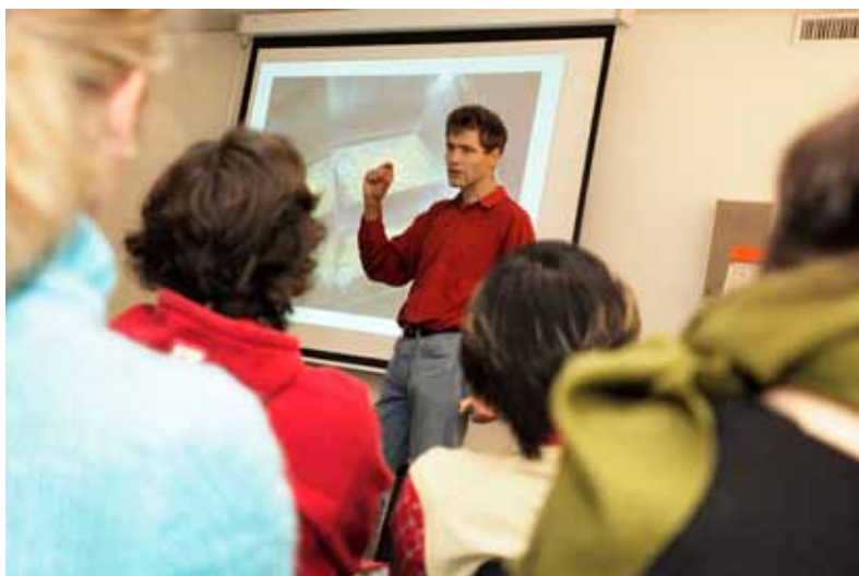
Marcel Kaufmann / bmi-bild.ch