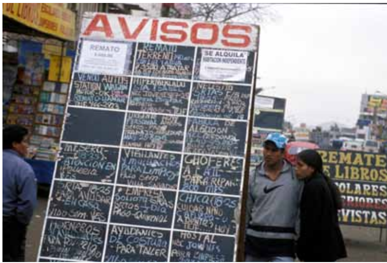
Marcel Kaufmann / bmi-bild.ch

être engagés se sont certes améliorées, mais le nombre de postes que compte ce marché de l'emploi reste très limité. Ici aussi le rôle – et donc les effectifs – du personnel local augmente dans les pays où sont réalisés les projets et les mandats de courte durée sont plus fréquents.