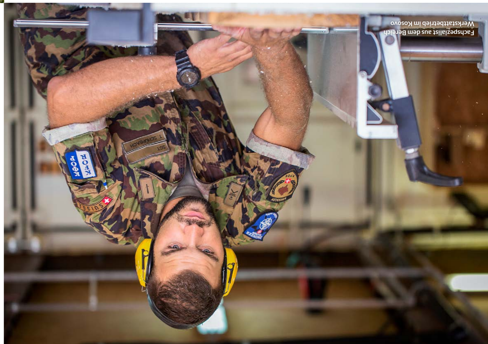
Fachspezialist aus dem Bereich Werkstattbetrieb im Kosovo