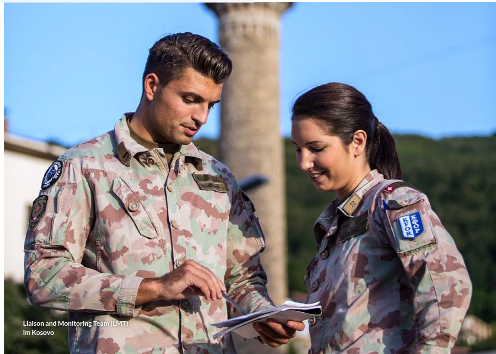
Liaison and Monitoring Team (LMT) im Kosovo

Für gewisse Funktionen ist das zivile Know-how entscheidend, was auch Frauen mit Schweizer Staatsbürgerschaft ohne militärische Grundausbildung einen Einsatz ermöglicht. Sie werden der Funktion entsprechend militärisch ausgebildet und ausgerüstet.