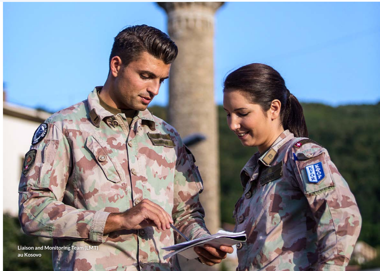
Liaison and Monitoring Team (LMT) au Kosovo

Le développement des capacités et le déminage humanitaire (DH) sont d'autres aspects de la promotion de la paix. Le développement des capacités fonctionne selon le principe « aider à s'aider soi-même » et soutient le développement de structures efficaces et durable sur place. Ce soutien est en règle générale apporté à partir de centres d'instruction régionaux de peace support, par exemple au Ghana et au Kenya. Dans le domaine DH, des spécialistes techniques sont recherchés dans les domaines de la logistique et de l'informatique.